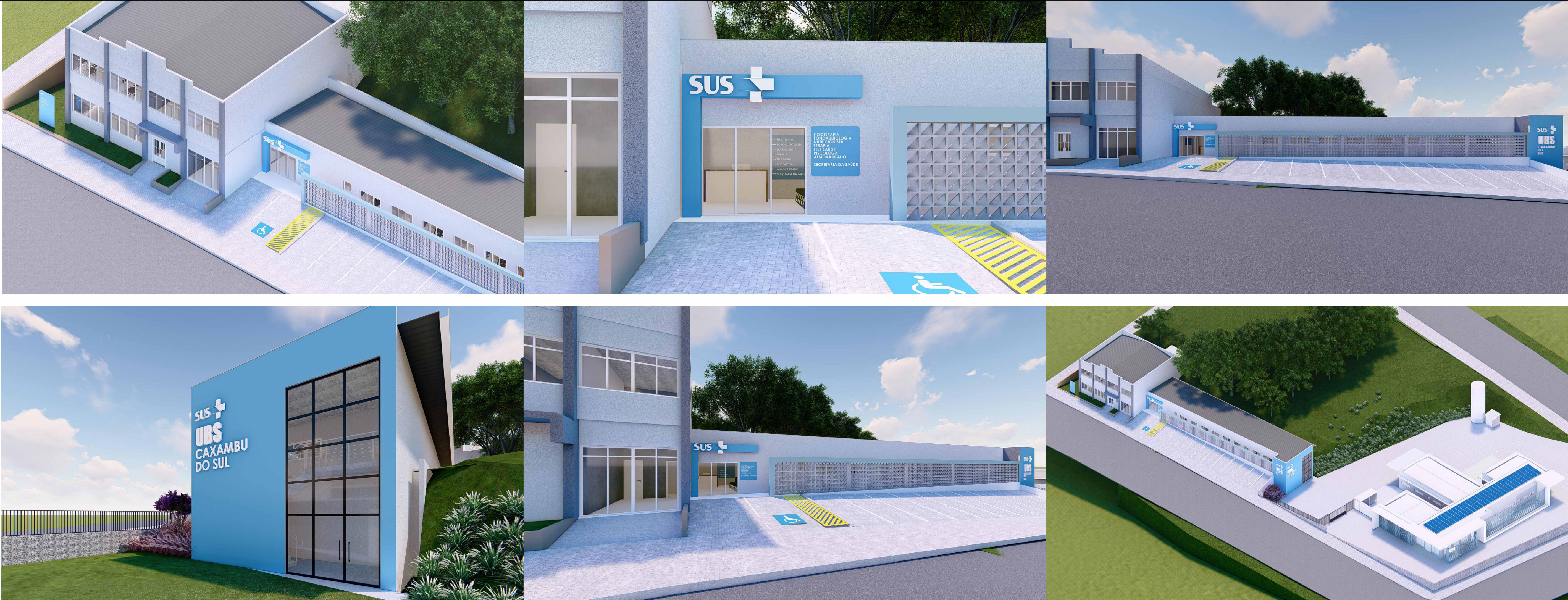
VISTA 3D Isométrico